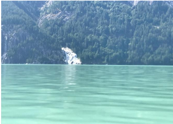
藍綠色的冰川泥海岸

我們的冰川海洋泥沉積於純淨的太平洋海域，蘊含豐富礦物質。這種「海淤泥」每天都會吸收來自海洋浮游生物的微量營養素，經證實對皮膚健康和身體護理極為有益。測試結果顯示，冰川泥 pH 值介乎 5.8 - 7.2，達到中性平衡，適用於不同的產品。