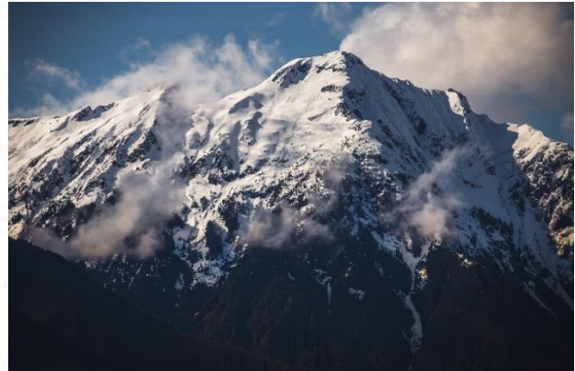
卑詩省最高的山峰、最大的冰川

冰川海洋泥能夠成為優質產品，全因其沉積區域擁有大量有益健康的礦物與元素。我們的泥田蘊含了這些重要成分，使沉積的冰川泥成為當今市場上最純淨、礦物成分最豐富的泥土之一。