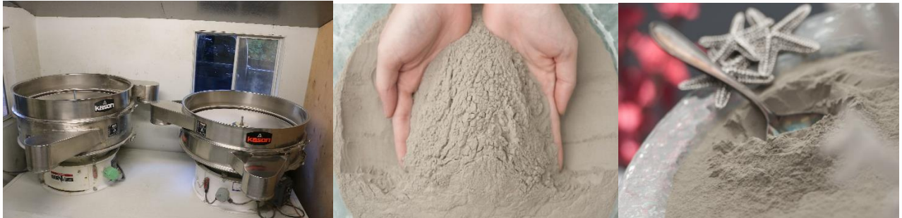
有機雜質、沙子及較大粒子被篩除，產生極為幼細的冰川泥粉末

冰川泥在 45,000 平方尺的大型溫室內，透過陽光焙乾至含水量低於 1%，然後被送往過濾，將夾雜於泥土中的沙子、雜質和有機物質篩走。我們會按客戶要求，將冰川泥粒子篩至平均尺寸為 6 – 20 微米（如糖霜顆粒的大小）。